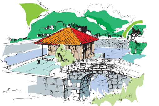
「琉歌百景」(ボーダーインク)上原直彦著より抜粋

すぐそまできた春の足音。野山も明るくなった。家に籠っておれようか。さあ、野外に出て春風に着物の袖をなびかせて遊ぼう。なんと清々しく、開放感を楽しめるこの嬉しさ。 【心浮ちやがゆる】 心が浮く。心うきうきのさま。